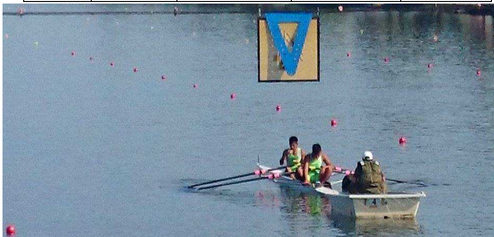
↑ これは貴重な写真ですよ。このアングルは〇〇じゃないと写せません。 発艇台より、スタート直前