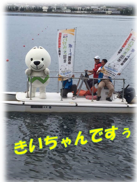
きいちゃんですう